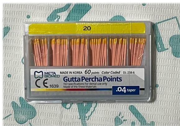
Figura 9. Conos maestros/principales 20/.04 – META.

Como agente sellador se utilizó el cemento endodóntico polvo – líquido Sealer 26 (Dentsply Sirona®, Charlotte, Carolina del Norte, Estados Unidos) a base de hidróxido de calcio. ( FIG. 10 ).