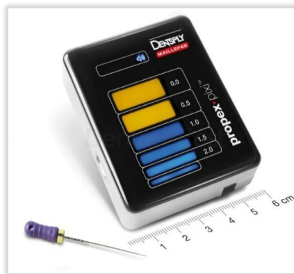
Figura 3. Localizador apical PropexPixi. Dentsply – Maillefer.

Una vez instrumentado el tercio cervical, se rectifican accesos y se toma la longitud de trabajo electrónica con localizador apical PropexPixi (Dentsply Maillefer®, USA) ( FIG.3 ) determinándola en 21 mm para los tres conductos.