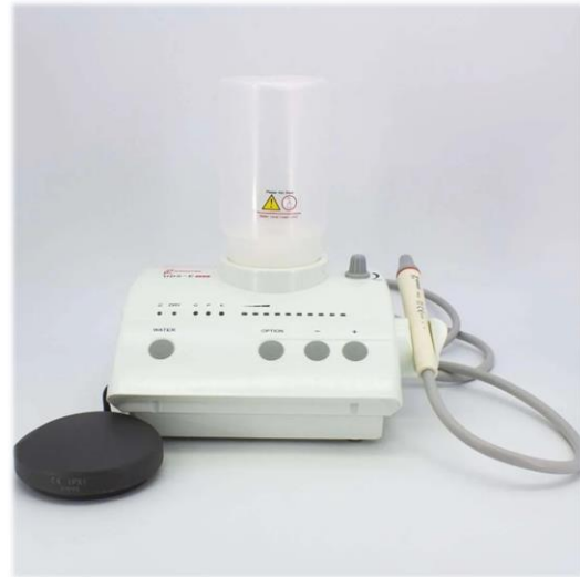
Figura 7. Ultrasonido USD-E – Woodpecker.

Con el propósito de eliminar el barro dentinario, se irrigó con 10ml de ácido etilendiaminotetraacético al 17% (EDTA - Tedequim®) ( FIG. 8 ), pH 7,3 y, para neutralizarlo, un último lavaje con solución fisiológica.