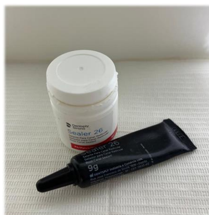
Figura 10. Cemento endodóntico Sealer 26 – Dentsply Sirona