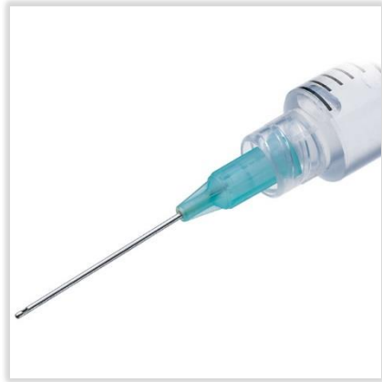
Figura 6. Agujas con salida lateral