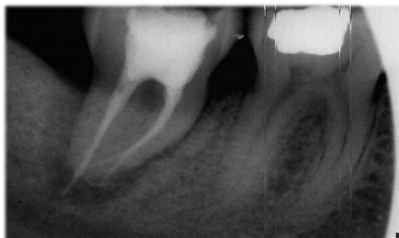
Figura 12. Radiografía posoperatoria.

Se puede observar la sobreobturación del cemento sellador.