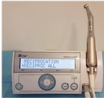
Figura 4. Sistema rotatorio VDW.