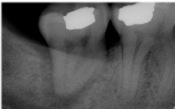
Figura 1. Radiografía preoperatoria. Se observa la lesión periapical.

En el examen radiográfico ( FIG. 1 ) se observa una imagen radioopaca en la corona del elemento dentario, compatible con la restauración. Los conductos radiculares se observan en todo su trayecto, con curvaturas distales en los canales mesiales. Se distingue una imagen radiolúcida a nivel apical radicular del elemento dentario compatible con una periodontitis apical crónica y se observa rarefacción ósea envolvente en las raíces del elemento dentario.