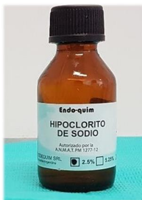
Figura 2. Hipoclorito de sodio al 5.25% - Tedequim.

Ya aislado el elemento dentario, se realiza una irrigación inicial con hipoclorito de sodio al 5,25% (Tedequim®) ( FIG. 2 ) y solución fisiológica.