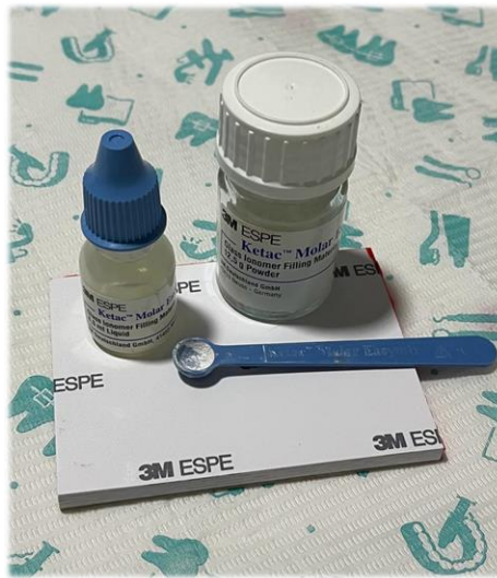
Figura 11. Cemento de ionómero vítreo Ketac Molar – 3M®.

La cavidad de acceso se obturó con cemento de ionómero vítreo Ketac Molar (3M®, USA) ( FIG. 11 ) y se realizó la toma radiográfica postoperatoria (Kodak E-Speed, Eastman Kodak Co., Rochester, NY) ( FIG. 12 ). En la misma, se comprobó una sobreobturación accidental con sellador.