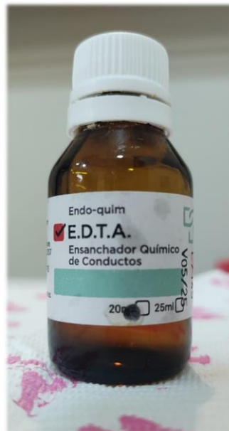
Figura 8. EDTA 17% - Tedequim

Con el propósito de eliminar el barro dentinario, se irrigó con 10ml de ácido etilendiaminotetraacético al 17% (EDTA - Tedequim®) ( FIG. 8 ), pH 7,3 y, para neutralizarlo, un último lavaje con solución fisiológica.