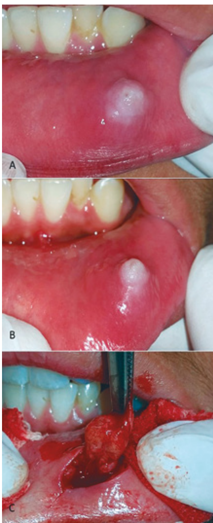
Figura 3: 3A: mucocelo pre escleroterapia. 3B: mucocelo luego de dos sesiones de escleroterapia. 3C: cirugía convencional de mucocelo esclerosado, el cual conserva la cápsula fibrosa intacta

petó el mismo orden procedimental. En primera instancia se realizó diagnóstico clínico basado en antecedentes de la enfermedad y en punción para identificar contenido mucoide. En la mayoría de los casos bajo anestesia local, se realizó drenaje del contenido del mucocelo, dejando un volumen residual que permita identificar dónde aplicar el agente esclerosante. Luego, se inyectó en el interior del mucocelo, polidocanol 2% hasta recuperar el volumen inicial del mismo. El procedimiento se repitió una vez por semana hasta que la lesión desapareció, o hasta que no fue posible drenar el contenido, o hasta que no fue posible identificar el sitio de inyección intralesional (Figura 1). Todos los pacientes fueron atendidos en la Cátedra de Clínica Estomatológica de la Carrera de Odontología de la Universidad Católica de Córdoba, respetando los procedimientos éticos de la Asociación Médica Mundial (Declaración de Helsinki). Todos los pacientes aprobaron la realización de los procedimientos a los que fueron sometidos, firmando un consentimiento informado.