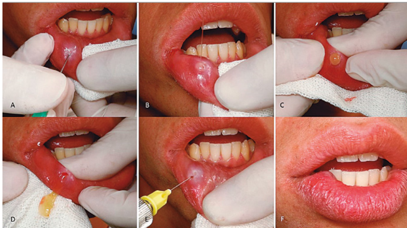
Figura 1: 1A: punción de mucocelo, con orientación tangencial. 1B: comprobación de contenido mucoide. 1C: compresión para drenaje de contenido. 1D: drenaje parcial de contenido. 1E: inyección intracapsular de polidocanol 2%. 1F: colocación de polidocanol hasta completar volumen inicial de mucocelo