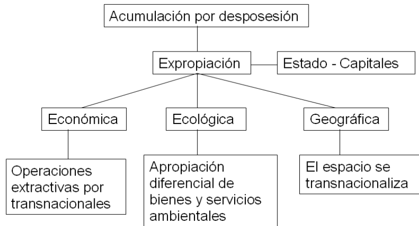
Fig. N° 5. Modalidades expropiatorias