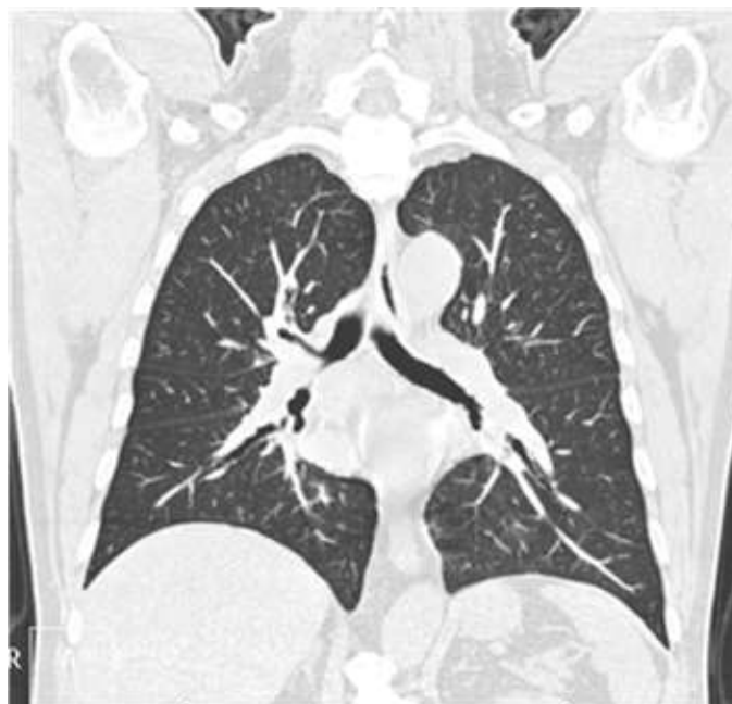
Foto 2: Se observa estenosis bronquial de bronquio fuente derecho