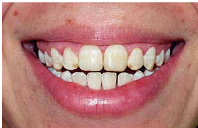
Figura 7: Caso terminado.

en las restauraciones durante la fase de control.