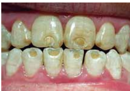
Figura 2: Otra vista del caso que muestra la magnitud de la malformación.