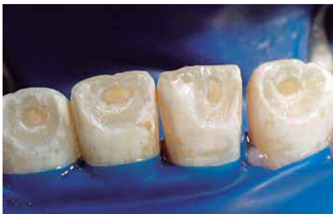
Figura 6: Macroabrasión de la superficie del esmalte.