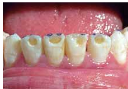
Figura 3: Registro de contactos oclusales.