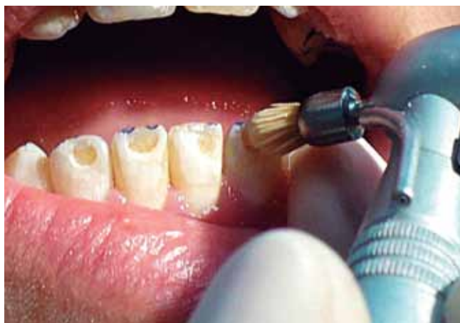
Figura 4: Profilaxis de la superficie.

mayor, producen menor calor friccional, además, al ser más abrasivas, el tiempo operatorio necesario para lograr la eliminación de las imperfecciones en esmalte es menor y puede realizarse en una sola intención. El uso de piedras diamantadas de grano fino y extrafino se puede reservar para la recreación de la micro-morfología superficial del esmalte en aquellos casos en los que sea necesario.