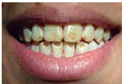
Figura 1: Fluorosis severa.

Por medio del interrogatorio se pudo conocer la presencia de lesiones similares dentro del núcleo familiar, madre y hermanos. En base a la información recopilada y tomando en cuenta que el lugar de procedencia de la paciente es una de las zonas con flúor en el agua de pozo que supera los niveles que el Código Alimentario Argentino (CAA) determina como contenidos límites inferior y superior que debería tener el agua potable de suministro público y de uso domiciliario,